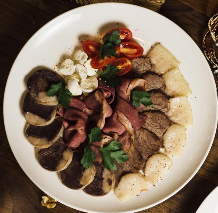
Жылқы етінен тіскебасар Деликатесы из конины