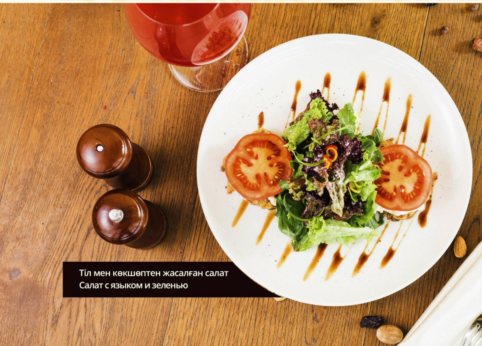
Тіл мен көкшөптен жасалған салат Салат с языком и зеленью