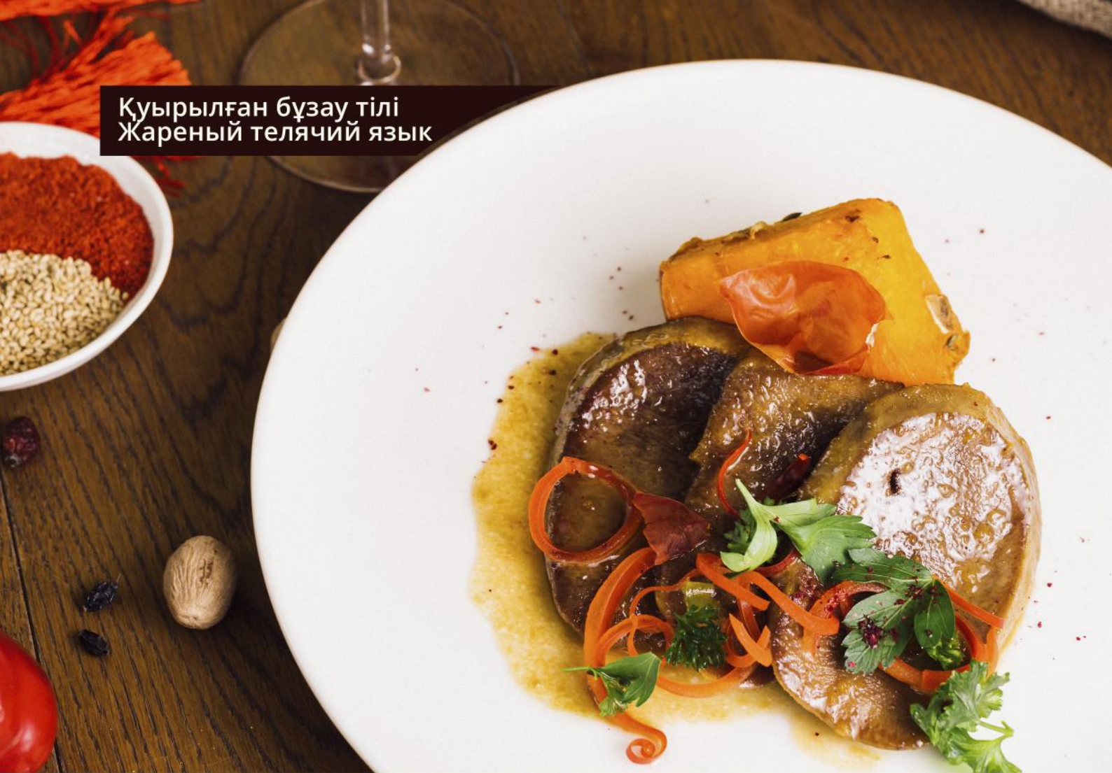
Куырылған бұзау тілі Жареный телячий язык