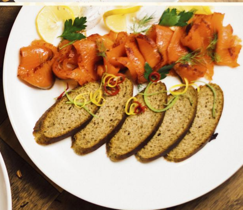
Тұздалған бақтақ Малосольная форель