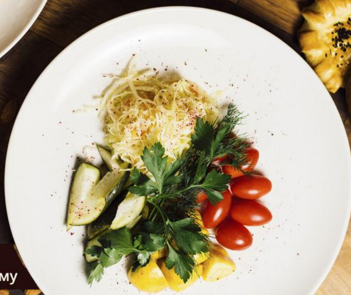
Тұздалған көкөністер Соленья по-домашнему