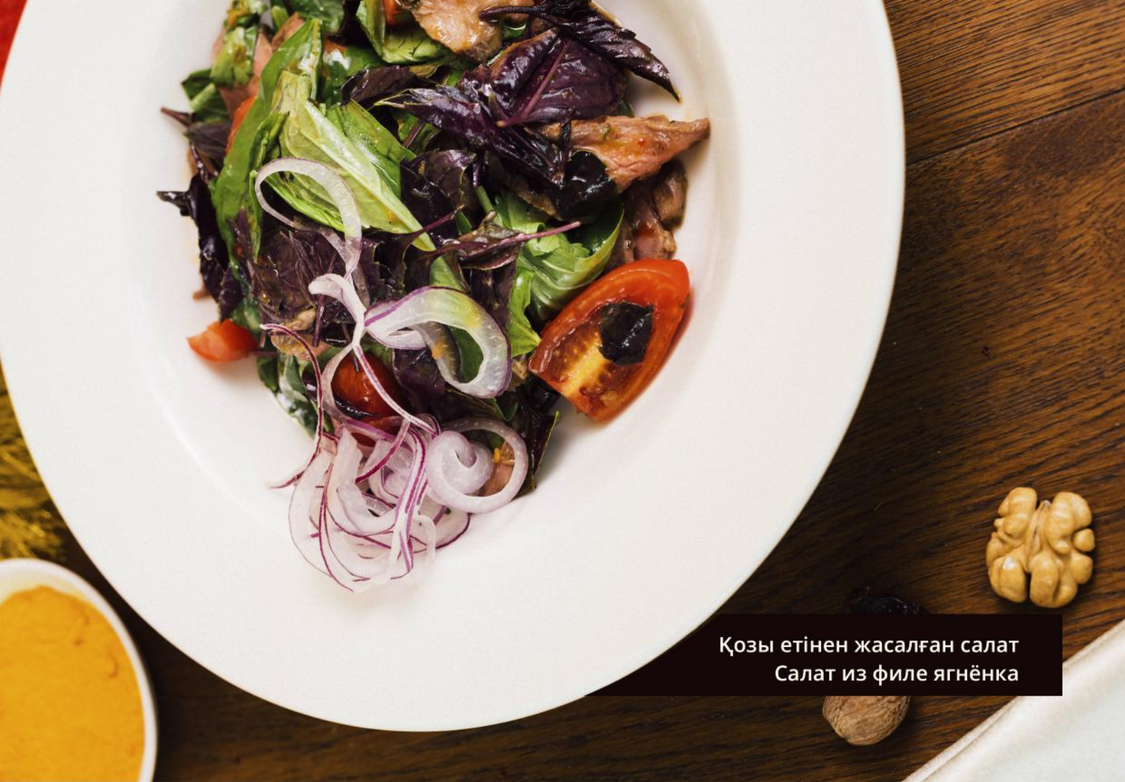
Қозы етінен жасалған салат Салат из филе ягнёнка