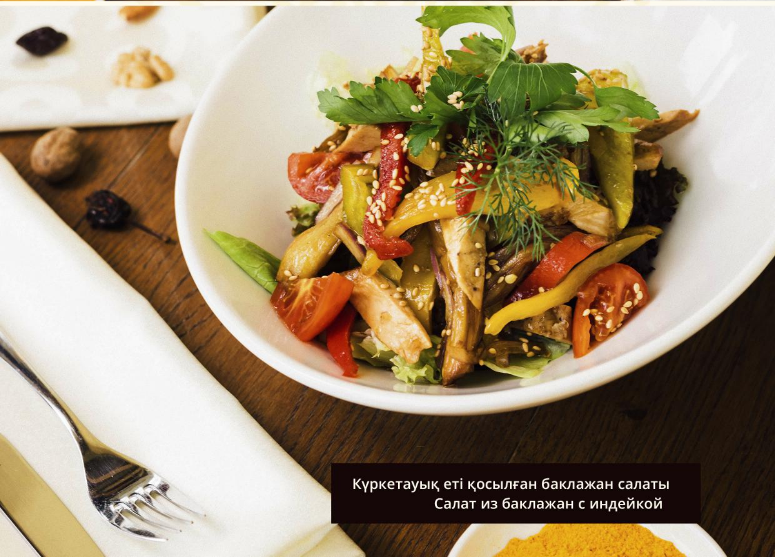
Күркетауық еті қосылған баклажан салаты Салат из баклажан с индейкой