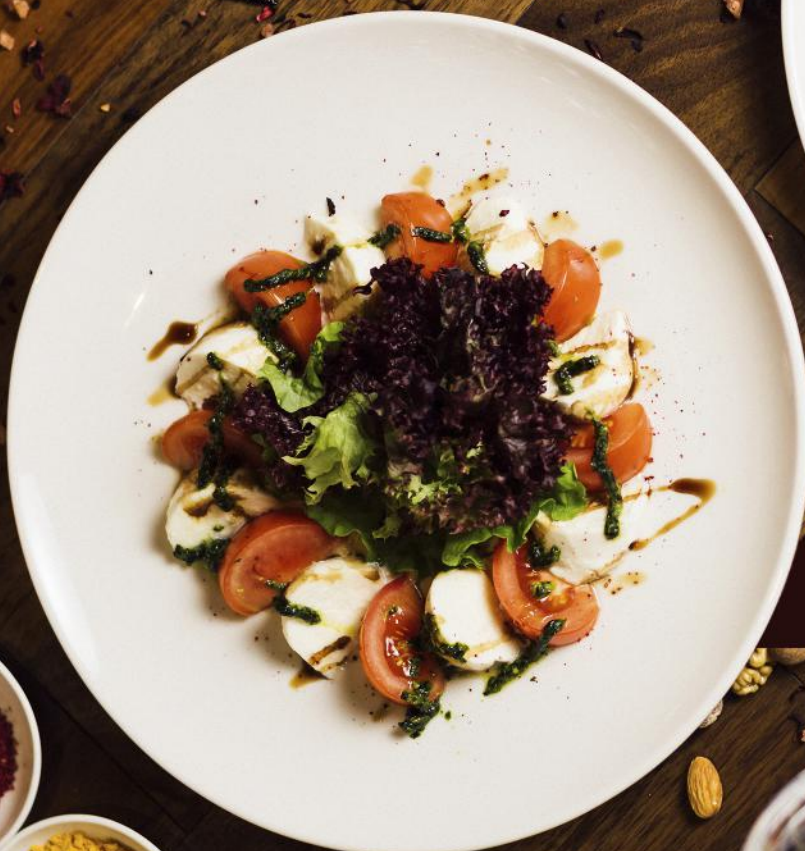
Үй ірімшігінен басытқы Закуска с домашним сыром