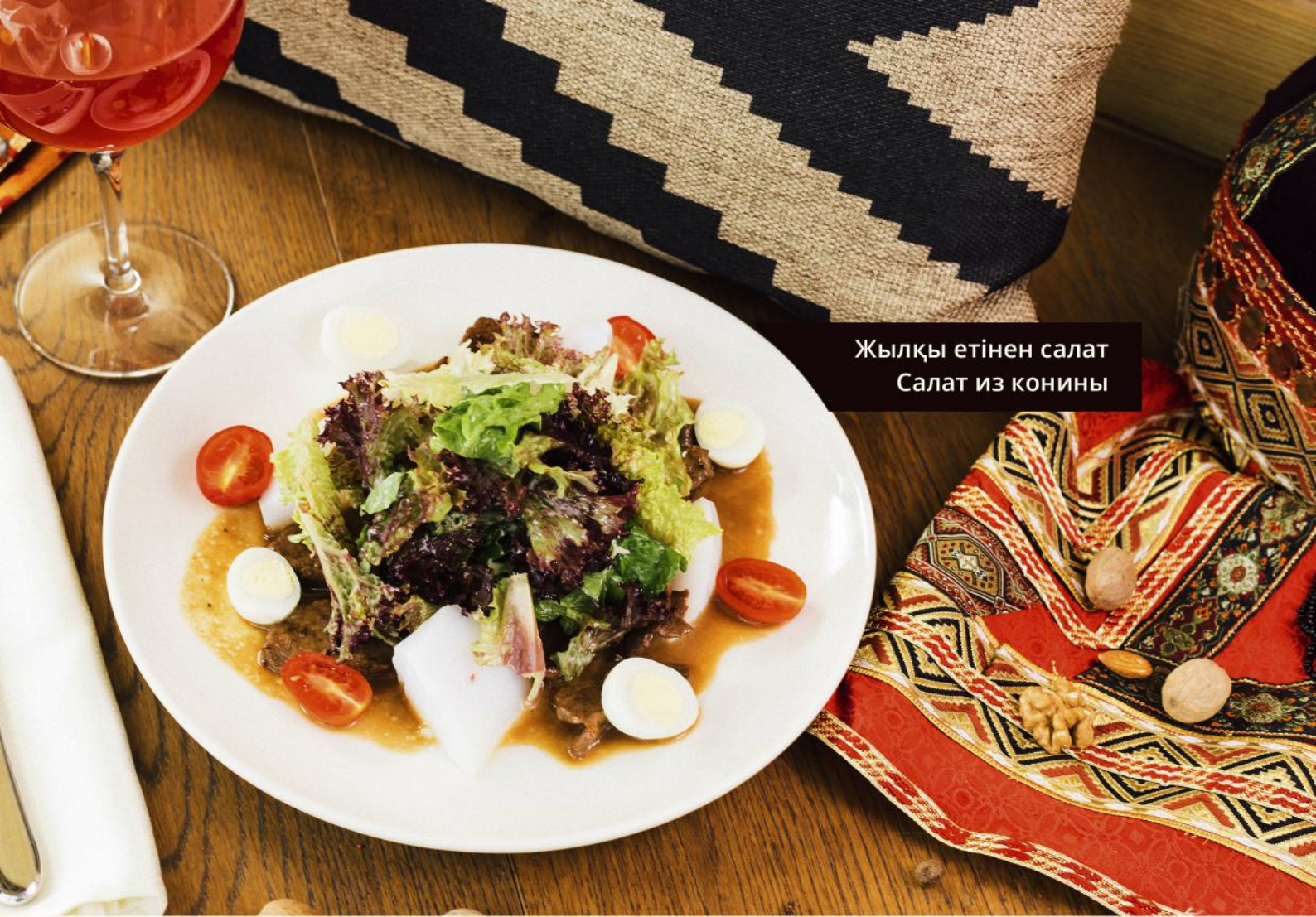
Жылқы етінен салат Салат из конины